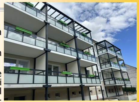
neue Balkone in Hohburg

Großes haben wir nächstes Jahr vor. Lesen Sie dazu den nachfolgenden Artikel.